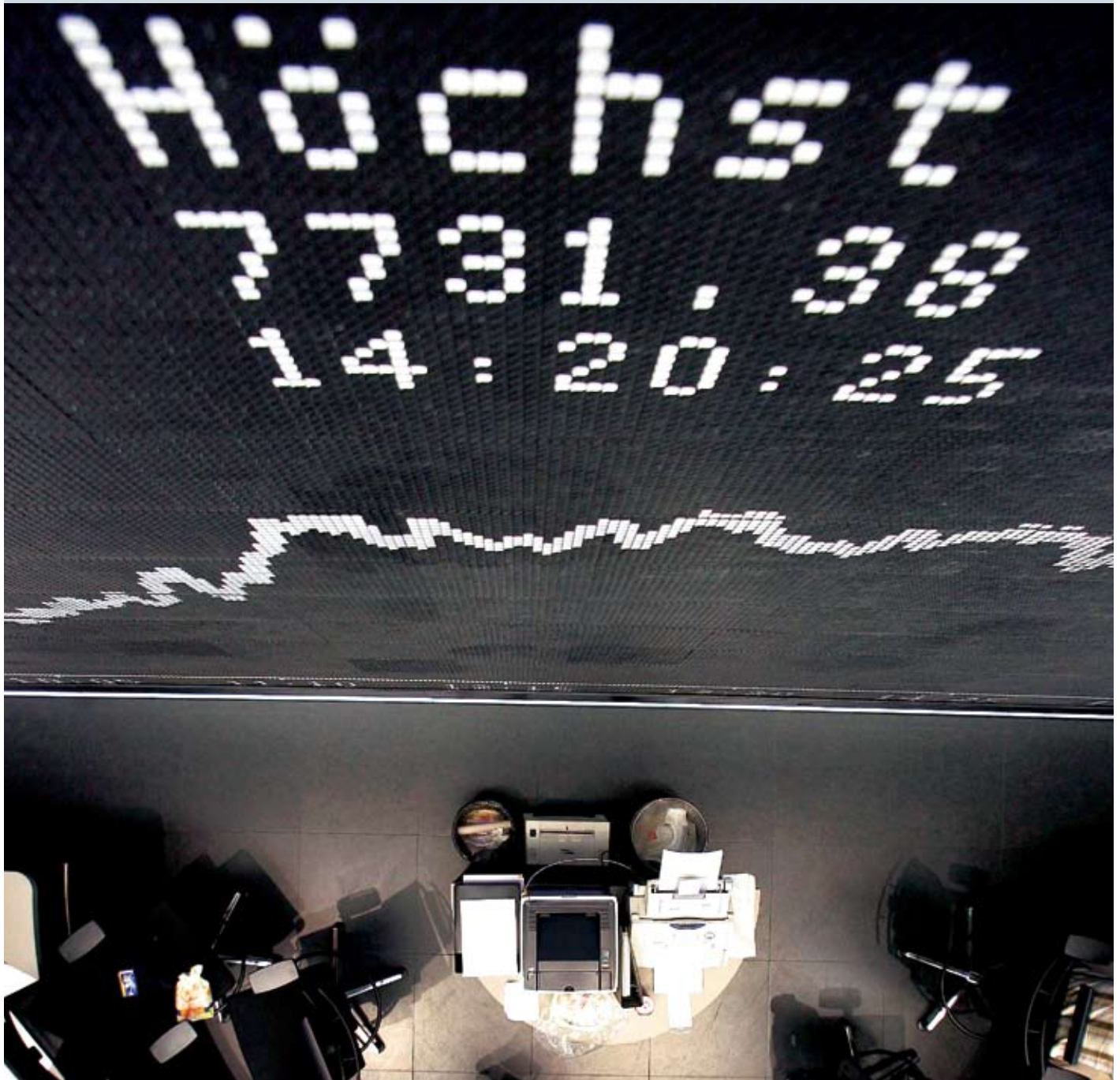
Börsenmakler in Frankfurt: lukratives Sparen mit Aktien