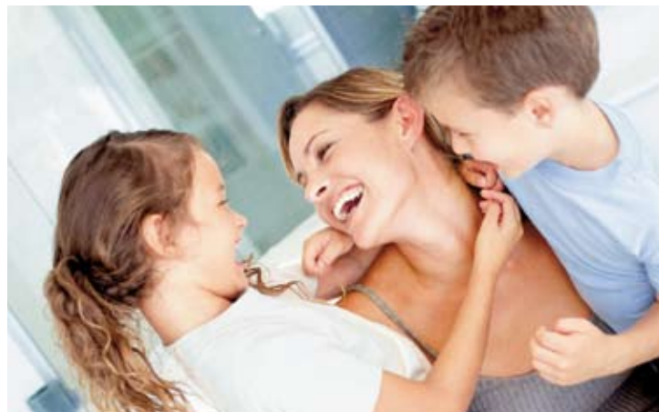
Familie: Früher Start sichert hohe Erträge

Besonderer Clou: Wer mit Riester-Fonds spart, darf nicht nur hohe Renditen erwarten, sondern engagiert sich zudem ohne Verlustrisiko. Am Ende der Sparzeit müssen die Fonds nämlich mindestens die eingezahlten Beiträge sowie die staatlichen Zulagen auszahlen. Da